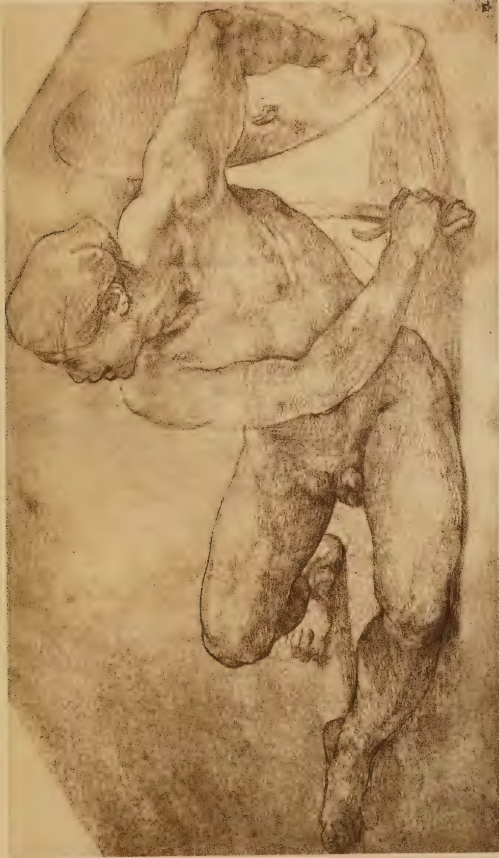
Etude d'un guerrier pour l'Eliodore